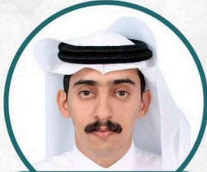
نائب الرئيس / محمد حسن مبارك